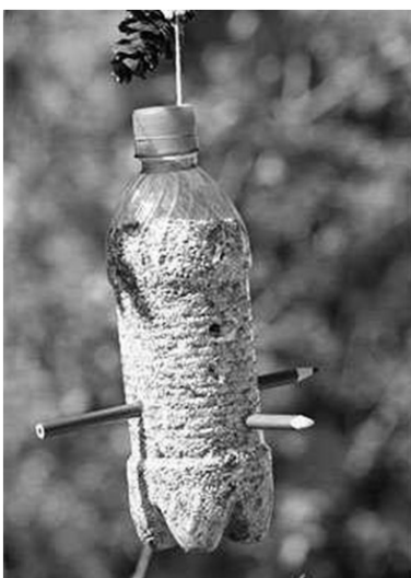
Mangeoire à Oiseaux